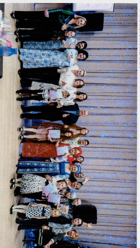
Рисунок 1 Районный конкурс "Тюем с мамой"