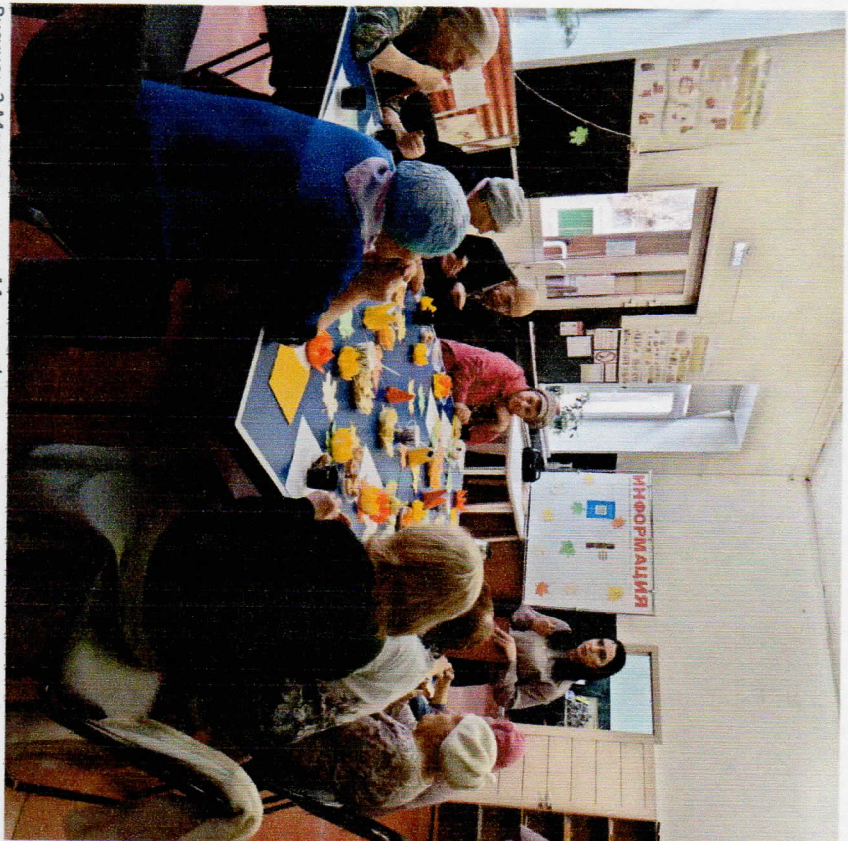
Рисунок 3 Мастер-класс «Моя профессия повар», совместно с проф. училищем