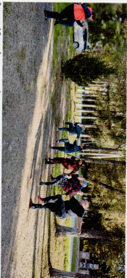
Рисунок 4 Ежедневная зарядка на свежем воздухе