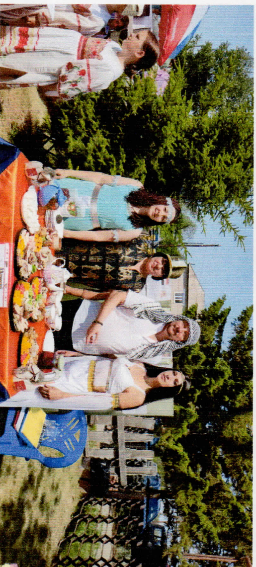
Рисунок 2 Районный фестиваль-конкурс "Необычайный фестиваль"